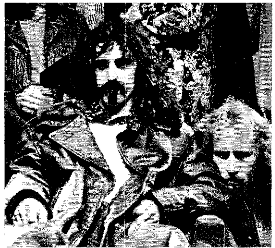
Underground-Komponist Zappa Brunnen der Liebe

dazu bringen könnte, sich in die Hose zu pissen."