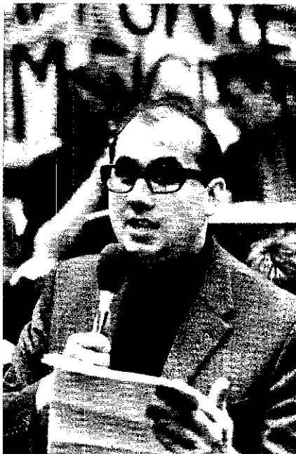
Gesuchter Mahler „In Urlaub“

Doch der Grenzkommandant begriff: „Wir haben schon genug trouble in diesem Land. Wir wollen nicht noch trouble mit diesen Leuten haben“ („We do not like to have additional trouble with these bastards“). Gegen 23 Uhr passierten die Reisenden die libanesisch-syrische Grenze. Um 23.40 Uhr zog Interpol Beirut hinter ihnen