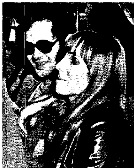
Gesuchter Baader, Gudrun Enßlin „Geld, Unterkunft und Freunde“

Aus West-Berlin herauszukommen erschien der Gruppe offenbar unproblematisch. Ein Untergrund-Genosse: