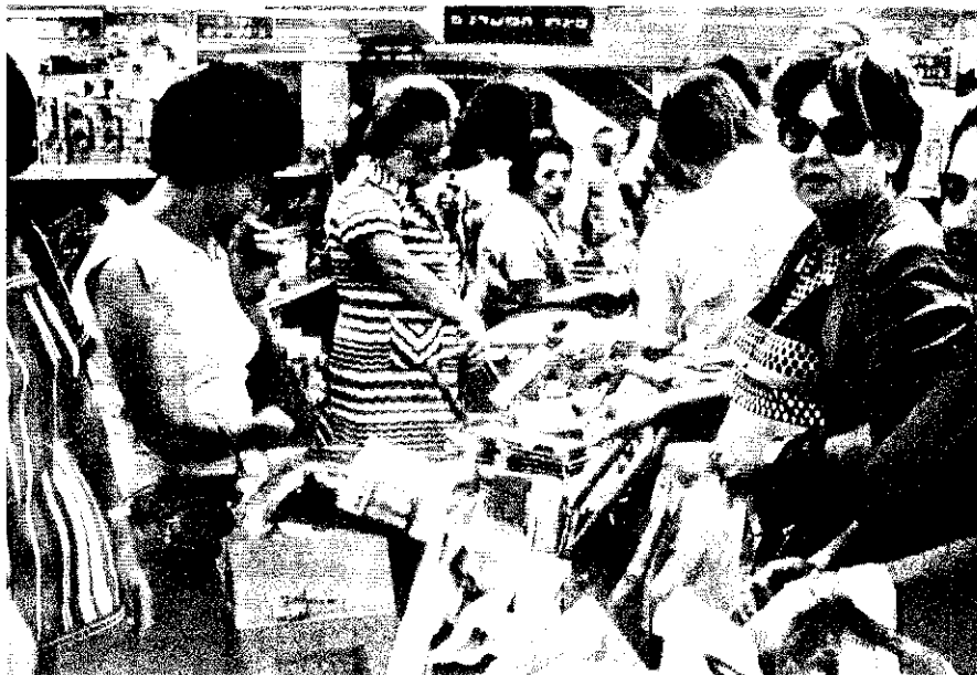
Panik-Käufe in Tel Aviv: „Das Volk pendelt zwischen Illusionen und Verzweiflung“

Die wachsenden Außenhandelsdefizite wurden zunächst durch amerikanische Beihilfen, großzügige Spenden