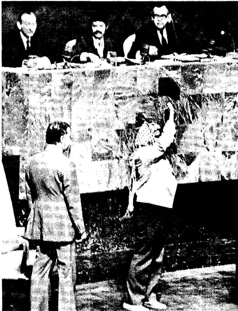
Palästinenser-Chef Arafat vor der Uno*: „Zionistisches Gebilde“

„Bis vor einem Jahr“, klagte ein westlicher Uno-Diplomat, und das heiße: bis zum Einsatz der Erdöl-Waffe, „konnten wir uns das Treiben der Negerstaaten in der Uno wie in einer Manege angucken und brauchten es nicht weiter ernst zu nehmen. Aber jetzt sieht es so aus, als ob wir selbst zur