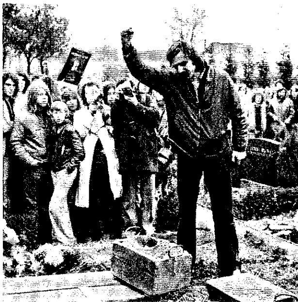
Revolutionär Dutschke am Grab von Holger Meins „Terror behindert Lernprozeß“

Dank für Ihre objektiven Beiträge zum Tode von Holger Meins und der Baader-Meinhof-Gruppe allgemein. Darf man sich aber trotz der eindringlichen Warnungen noch soviel Objektivität zu diesem Thema erlauben, ohne in den Verdacht zu geraten, Sympathisant dieser Gruppe zu sein? Mutig, mutig.