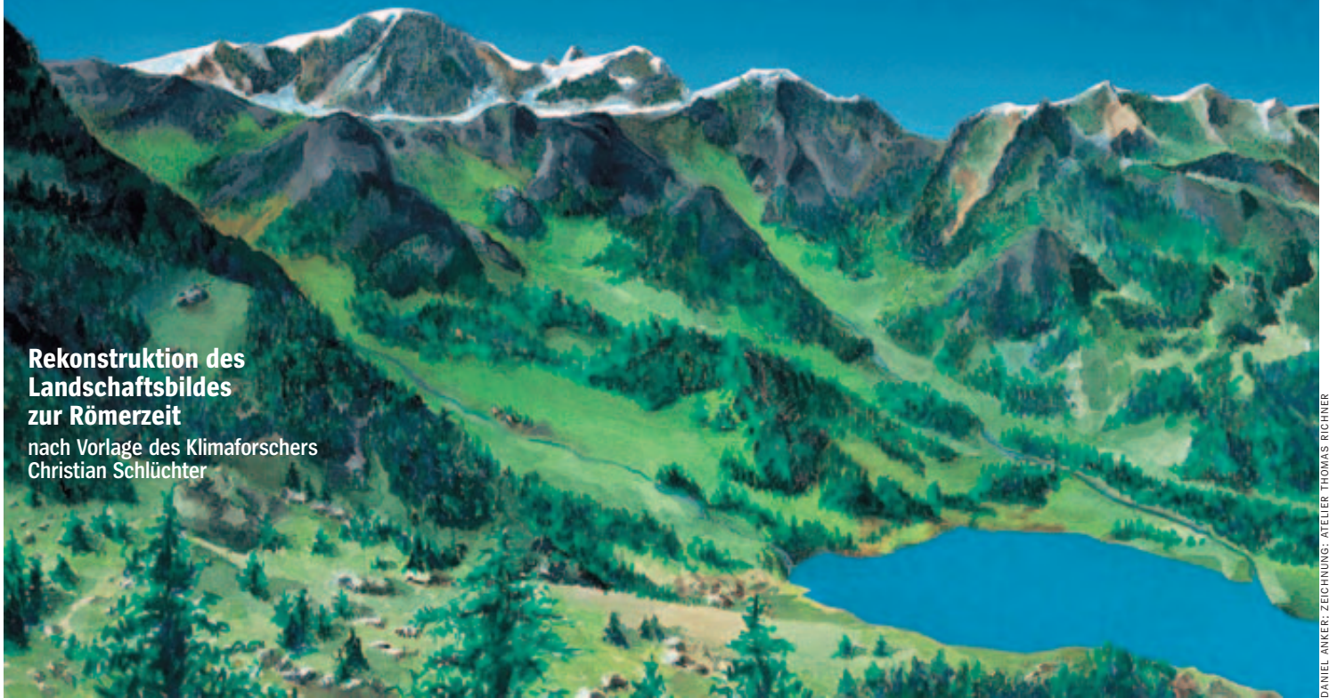
DANIEL ANKER; ZEICHNUNG: ATELIER THOMAS RICHNER

nach Vorlage des Klimaforschers Christian Schlüchter