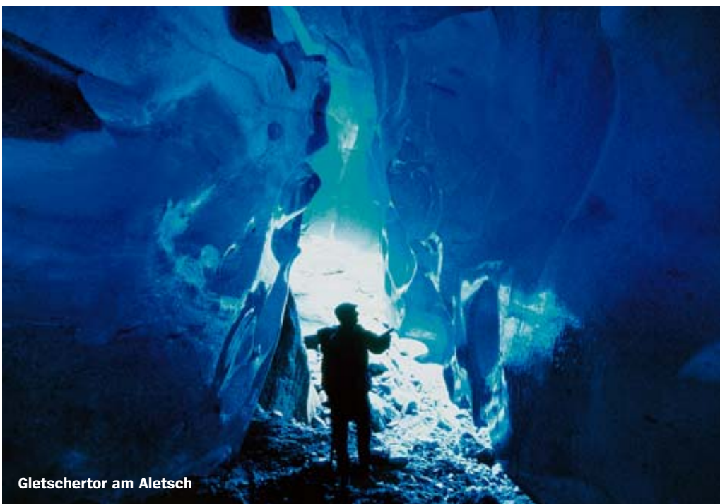
Gletschertor am Aletsch

Zunächst sammelte er auf Exkursionen mit Studenten über tausend kleine Holzspäne und Torfketten aus dem Vorfeld von Gletschern, die meisten „von der Größe durchschnittlicher Ham-