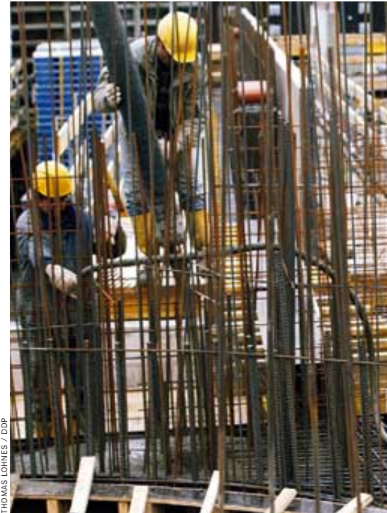
Arbeiter bei herkömmlichem Betongießen, Roboter

eine Mauer bauen kann, der kann auch ein Haus bauen.“