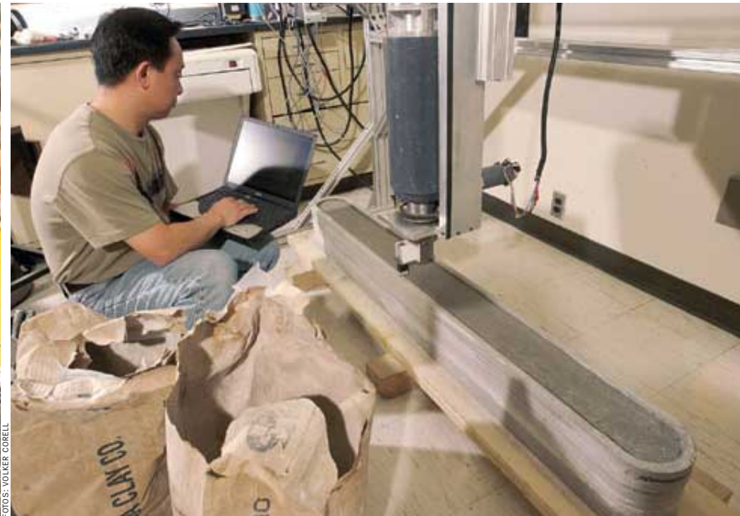
bei Herstellung einer Wand: „Größte Errungenschaft seit der Chinesischen Mauer“

Wände etwa, die kaum aufwendiger oder teurer wären als gerade. So könnten Häuser in Serie entstehen, wie vom Fließband – aber auch individuell gestaltete Einzelanfertigungen wären problemlos möglich.