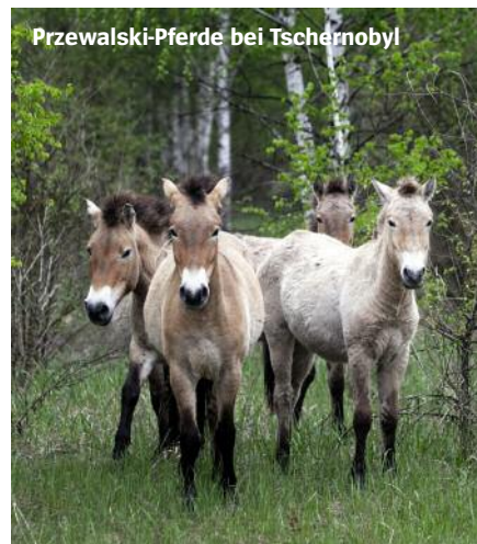
Przewalski-Pferde bei Tschernobyl

So wuchert es weiter wild in der verstrahlten Sperrzone von Tschernobyl. Ungestört tummeln sich dort Pferde, Adler und Wölfe, es sprießen die Birken. Vor allem aber: Spekulationen und Mythen. Hilmar Schmundt