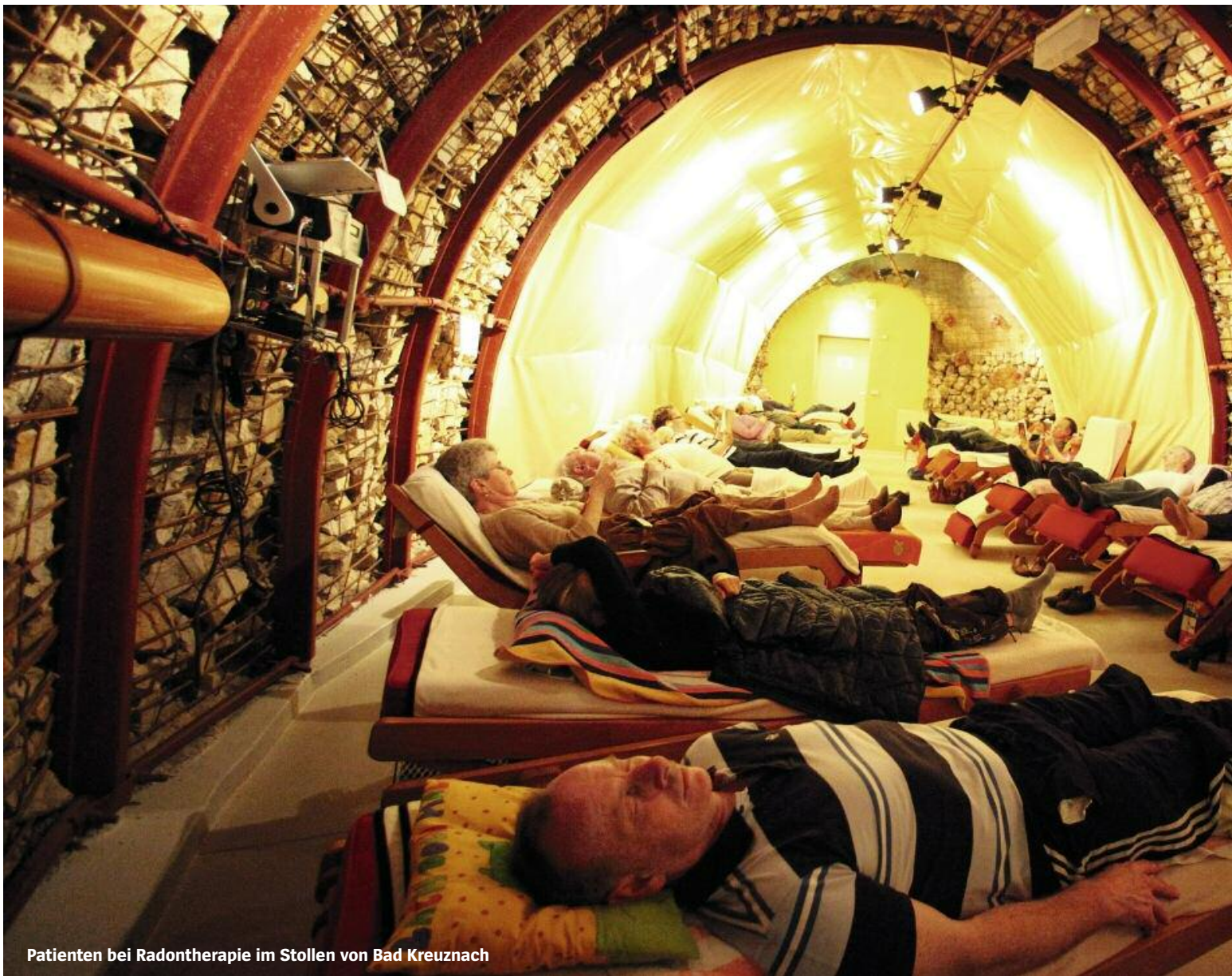
Patienten bei Radontherapie im Stollen von Bad Kreuznach