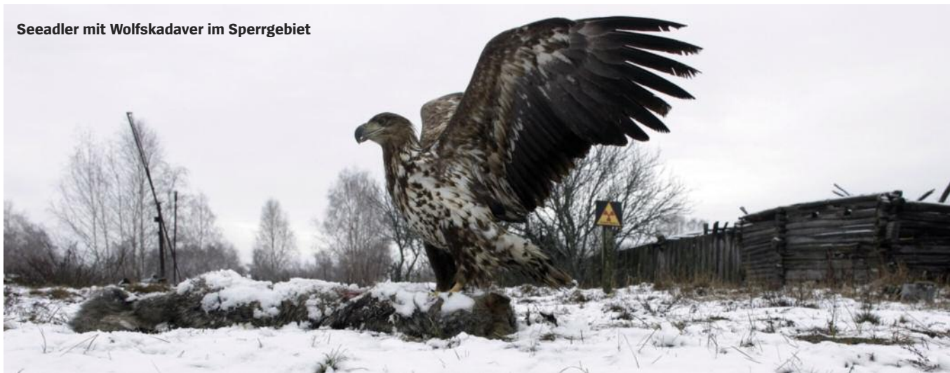
Seeadler mit Wolfskadaver im Sperrgebiet