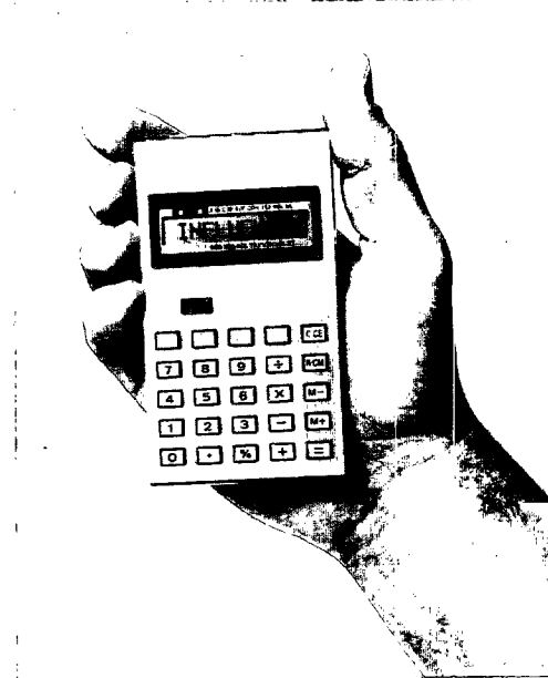
Elektronisches Wörterbuch „Alpha 8“ Lernen mit der Memo-Taste

ter oder Redewendungen gespeichert werden.