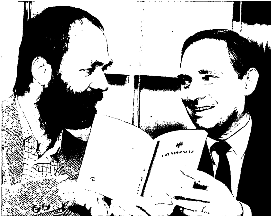
Kontrahenten Meckel, Schäuble: „Jede Stimme zählt gleich“

Innenminister Wolfgang Schäuble und Markus Meckel, Vize der DDR-SPD, über die künftige Verfassung