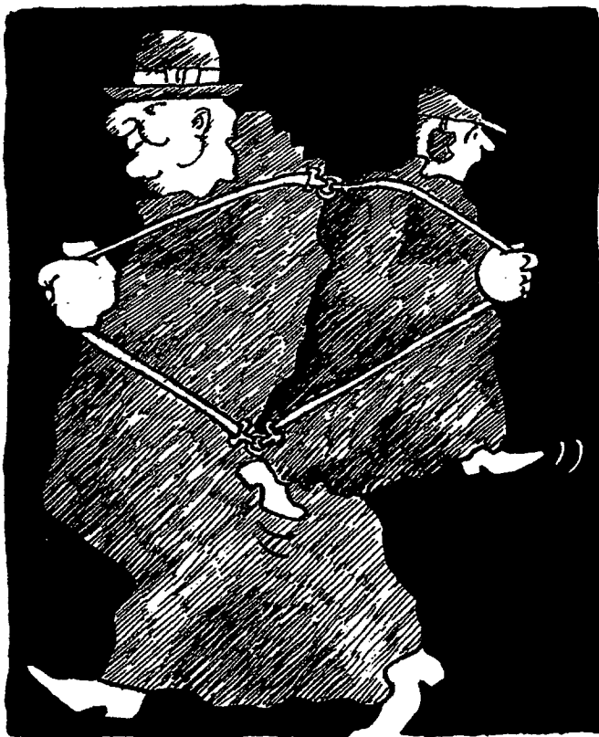
Einer trage des anderen Last

SCHÄUBLE: Ich kann wirklich nicht erkennen, warum wir unsere Verfassung mit weiteren, das Eigentum schwächenden Elementen verstärken sollten. Was das Staatsziel Umwelt angeht, sind wir bei uns mitten in den Gesprächen.