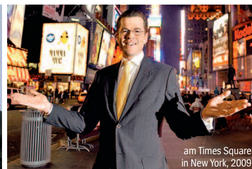
am Times Square in New York, 2009

30. Oktober Der CSU-Parteivorsitzende Horst Seehofer ernennt Guttenberg zum Generalsekretär der Partei.