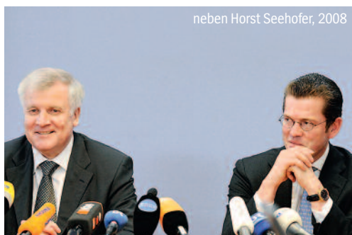
neben Horst Seehofer, 2008