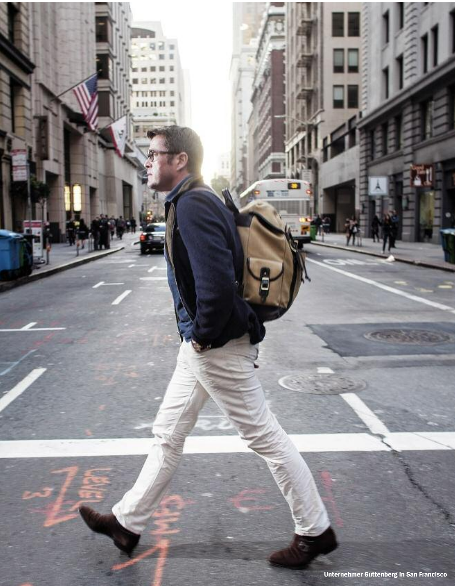
Unternehmer Guttenberg in San Francisco