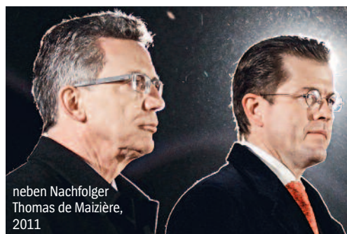
neben Nachfolger Thomas de Maizière, 2011