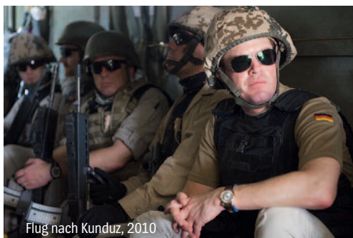
Flug nach Kunduz, 2010