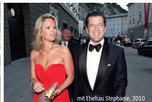
mit Ehefrau Stephanie, 2010

Mai Während der drohenden Pleite des Autoherstellers Opel spricht sich Guttenberg für ein geordnetes Insolvenzverfahren und gegen eine staatliche Rettung aus, kann sich aber nicht damit durchsetzen.