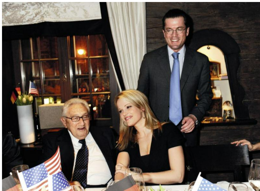
Freunde Kissinger, Ehepaar Guttenberg*: „From Government to Goglement“

Sonst fällt ihm so schnell niemand ein. Ende Januar ist er zu Besuch in Berlin. Er sitzt in der Lobby des Adlon, Sakko und schwarzes Poloshirt. Er erzählt von seinen Terminen. Am Sonntag hat er Merkel getroffen, dann war er noch schnell in