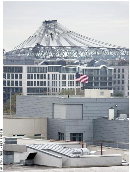
Dach der US-Botschaft in Berlin

Merkel hat schon öfter, halb im Ernst, halb im Scherz gesagt, sie gehe ohnehin da-