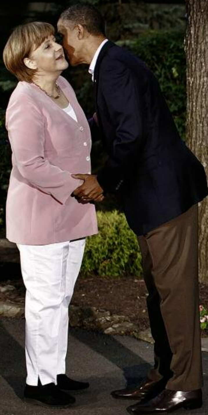
Partner Merkel, Obama im Mai 2012 in Camp David

Den deutsch-amerikanischen Beziehungen droht eine Eiszeit. Offenbar haben die US-Geheimdienste nicht nur das Handy von Kanzlerin Angela Merkel überwacht, sondern die Botschaft in Berlin als Horchposten benutzt.