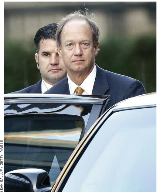
Kanzleramtschef Pofalla, US-Botschafter Emerson: Tiefpunkt der deutsch-amerikanischen Beziehungen

spruch. Er sagt: „Deutschland wurde nach den Anschlägen vom 11. September 2001 zum Aufklärungsziel Nummer eins in Europa.“ Die US-Regierung habe den Deutschen nicht vertraut, weil einige der Todespiloten des 11. September in Hamburg gelebt hätten. Einiges spreche dafür, dass die NSA Merkel einmal erfasst hat und dann berauscht vom Erfolg war, sagt Drake: „Es hat bei der NSA schon immer die Devise gegeben, so viel abzuhören wie nur geht.“