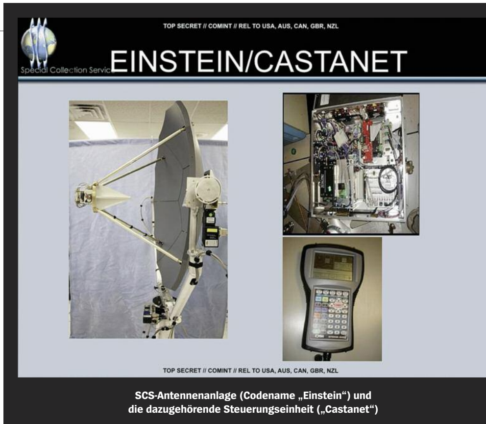
SCS-Antennenanlage (Codename „Einstein“) und die dazugehörige Steuerungseinheit („Castanet“)

Die NSA, vom SPIEGEL um Stellungnahme gebeten, verweigerte jeden Kommentar.